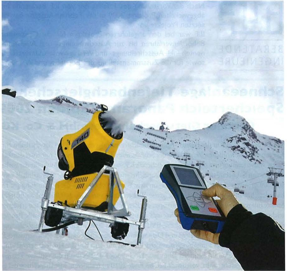
Die T40 lässt sich auch über die besonders komfortable optionale Bluetooth-Funkfernbedienung steuern.

SAM, Grenoble, 21. bis 23. April 2010 am Stand Nr. 707