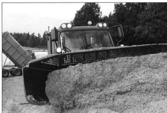
Der PistenBully 300 GreenTech bei der Einbringung von Mais-Silage.