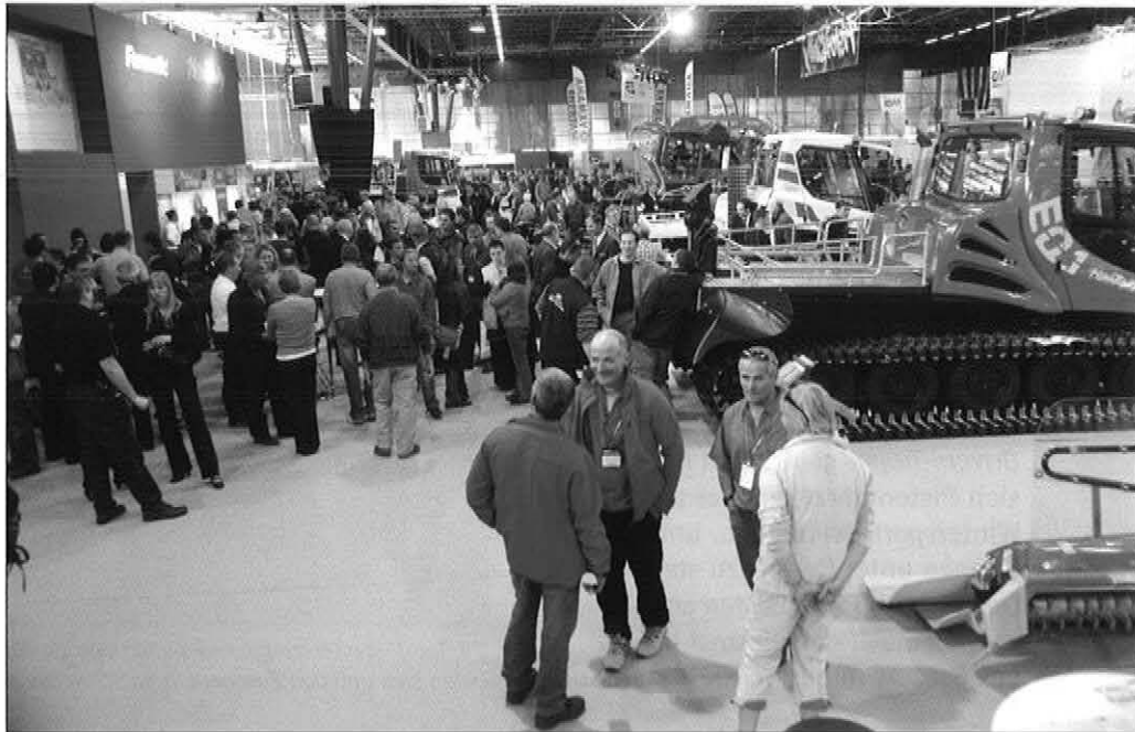
Der SAM-Messestand von KÄSSBOHRER war wie immer besonderer Besuchermagnet.

Damit unterstützt das System die Fahrer bei der Arbeit, optimiert die Qualitätskontrolle der durchgeführten Arbeiten und ist ein wesentlicher Beitrag zu mehr Sicherheit für die Fahrer. Das SNOWsat -System ist für den PistenBully 600 sowohl als Erstausrüstung ab Werk lieferbar, kann aber auch jederzeit nachgerüstet werden.