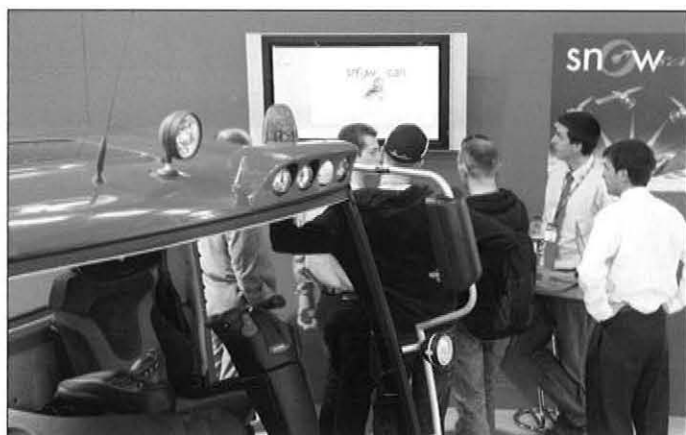
Besucher informieren sich, was das SNOWsat-System im Bereich Schneetiefenmessung und GPS-Navigation leistet.

Mit dem PistenBully Paana zeigte KÄSSBOHRER das kleinste Loipen-