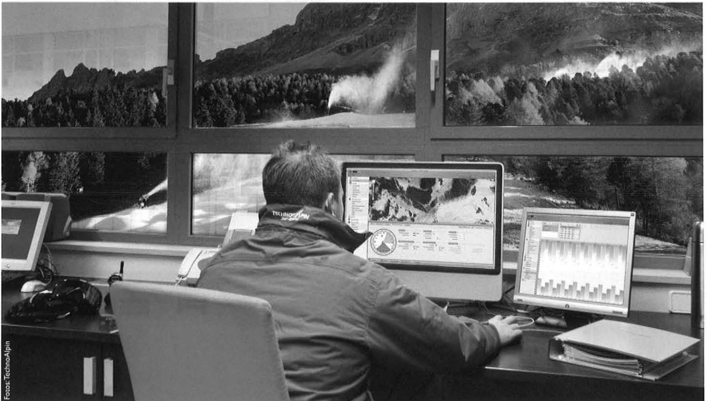
Durch die intelligente Software ATASSplus wird ein effizienter Einsatz von Ressourcen gewährleistet. Eine gleichmäßige Schneequalität vom Berg bis ins Tal garantiert reinstes Skivergnügen.

Die neue Version der Steuerungssoftware ATASSplus von TechnoAlpin setzt neue Maßstäbe.