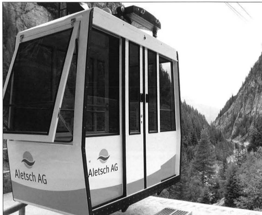
Im 50. Bestandsjahr präsentiert sich die Luftseilbahn Rischinen-Massa perfekt runderneuert.

Die 1961 erbaute Anlage erschließt die Massaschlucht und wird als Werkseilbahn betrieben. Die Luftseilbahn Rischinen-Massa ist eine einspurige Dreiseil-Pendelbahn mit einer Kabine für 10 Personen. Sie führt über insgesamt vier Stützen von Blatten/Belalp im Wallis zur Bergstation am Fuße des Aletschgletschers.