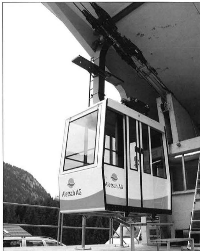
GANGLOFF lieferte die neue 10er-Kabine.