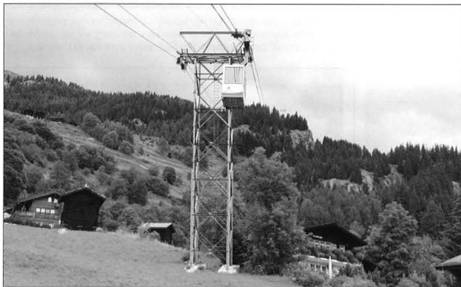
Das Ziel des Umbaus ist die Anpassung der Anlage an die Vorschriften und den Stand der Technik. Der komplette Antrieb, alle Seilscheiben und die Steuerung sowie die Kabine und das Gehänge wurden ausgetauscht. Das Laufwerk und alle Seilreiter wurden im Werk komplett revidiert. Die Fundamente der Stützen und der Bergstation erfuhren eine Sanierung und Verstärkung.