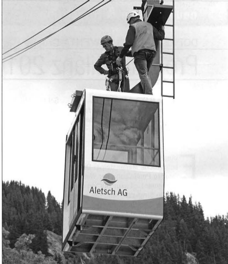
Ende Juni erfolgte die Abnahme durch die zuständigen Behörden, die Kontrollstelle IKSS und das zuständige Departement des Staates Wallis.

Die Kontrollstelle IKSS und das zuständige Departement des Staates Wallis haben Ende Juli die Luftseilbahn inspiziert und abgenommen. Die STEURER Seilbahnen AG konnte damit dem zufriedenen Kunden die Seilbahn pünktlich für den Betrieb übergeben.