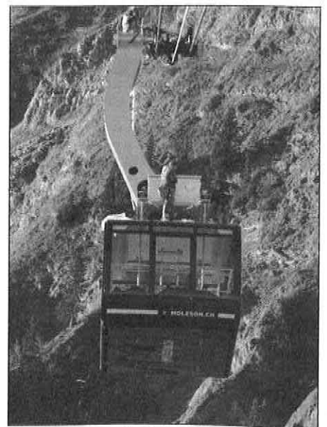
Der Gipfel des Moléson ist ab sofort mit top-modernen GANGLOFF-Kabinen erreichbar.