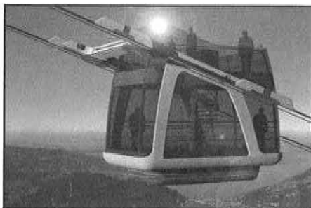
Derzeit im Bau und im Mai 2012 am Seil: Die sensationelle Cabrio-Bahn auf das Stanserhorn.

Zwei GANGLOFF-Masterpieces sind in Frankreich und in der Schweiz zu bewundern.