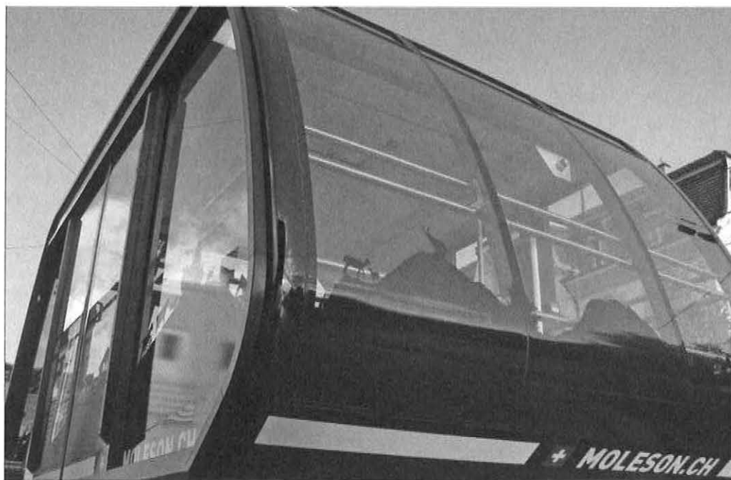
Die attraktive Neue bringt die Gäste besonders komfortabel auf den Gipfel des Molèson.

Im Schweizer Skigebiet Molèson transportieren die neuen Kabinen mittlerweile auch die zufriedenen Gäste in die landschaftliche Schönheit der Freiburger Alpen. Die 30-Personen-Kabinen wurden durch komfortable 60-Personen-Kabinen ersetzt. So geht es nun doppelt so schnell ins Skivergnügen.