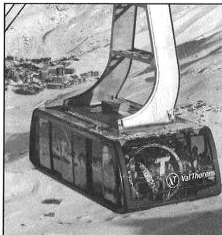
Val Thorens gibt sich mit seinen neuen Kabinen auch betont farbenfroh.