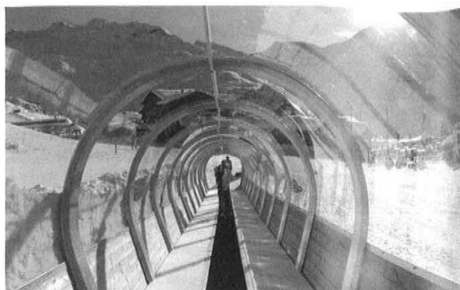
Sonnenschein pur in Les Menuires: Eine einzigartige Kombination aus dem Gefühl eines offenen Raumes und gleichzeitigem Schutz vermittelt die neue EVOLUS Galerie von SunKid.

Vor genau 10 Jahren präsentierte SunKid als erster Produzent weltweit eine Überdachung für seine Förderbänder. In Folge lernten die Fahrgäste als auch die Betreiber sehr rasch die Vorteile dieser Überdachung zu schätzen, sei es zum einen als Wetterschutz während der Beförderung oder zum anderen durch den verminderten Wartungs- und Reinigungsaufwand. Ein Jahrzehnt der kontinuierlichen Entwicklung an der bisherigen Förderbandüberdachung gipfelt nun in der Einführung der von Grund auf neu konstruierten SunKid Galerie EVOLUS. Das Ergebnis kann sich sehen lassen: Die neue Optik und Formgebung wurde konsequent unter der Vorgabe nach mehr Raumgefühl umgesetzt, ohne dabei die Stabilität der Konstruktion aus den Augen zu verlieren. In Les Menuires wurde die Überdachung auf besonderen Wunsch des Kunden