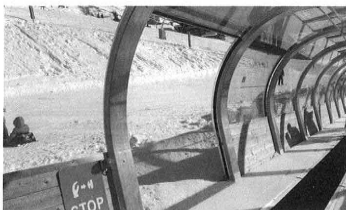
Die seitlichen Schiebetüren erfüllen alle erforderlichen technischen Auflagen und lassen sich durch eine ausgeklügelte Technik gänzlich ohne Muskelkraft öffnen.

► Der Abstand der Bögen ist individuell einstellbar (1,5m–2,5m) und kann so kostenoptimal auf die Schnee- und Windlasten abgestimmt werden. Zusätzlich vermittelt der individuelle Abstand (größere Abstand) der Bögen ein noch freieres Raumgefühl im Inneren der Galerie.