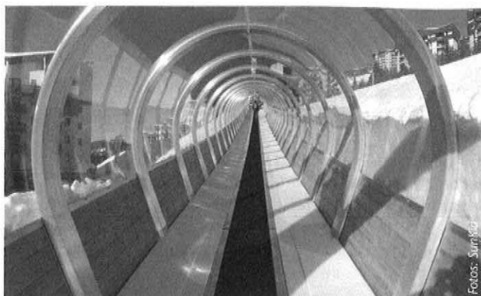
Im französischen Les Menuires wurde heuer eine SunKid Galerie EVOLUS in der Kombination Polycarbonat-Aluminium-Holz installiert.

Als Alternative zur bisherigen Bubble Galerie entwickelte SunKid mit der Galerie EVOLUS eine von Grund auf neu konstruierte Förderbandüberdachung aus Aluminium und Polycarbonat