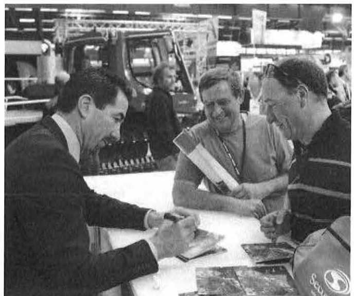
Luc Alphand, ein französischer Star ohne Berührungängste, gab am Stand von Kässbohrer Autogramme.

Beginn der AfterWork-Party: ab 9.00 Uhr Start des Wettkampfes: 13.00 Uhr Siegerehrung: ab 19.00 Uhr