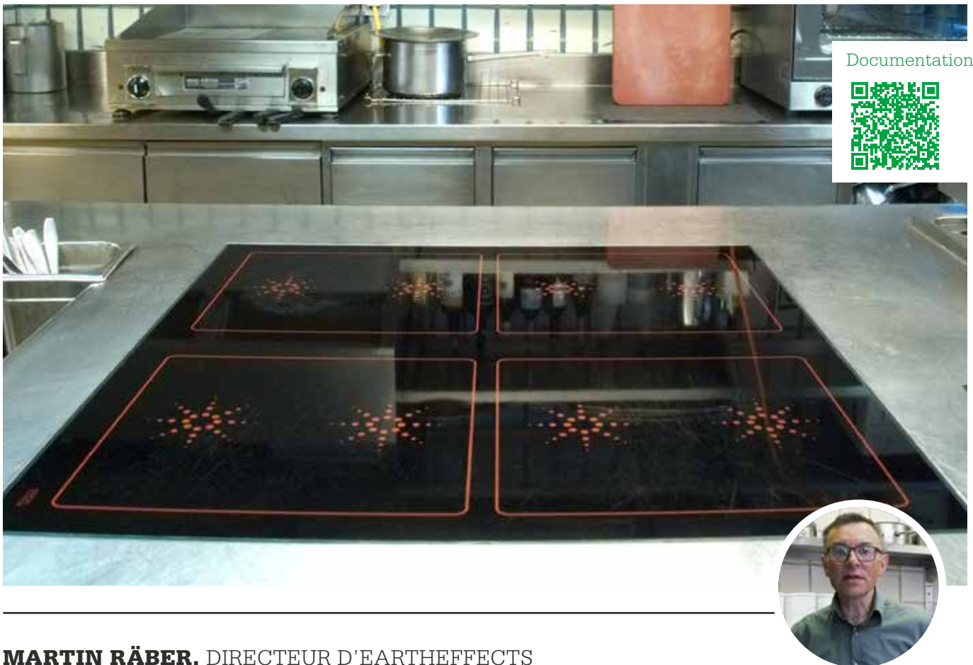
MARTIN RÄBER , DIRECTEUR D'EARTHEFFECTS

Coûts investissement d'env. 15 000 à 100'000 francs Contribution d'encouragement max. 6000 francs en espèces ou 10'000 francs sous forme de batterie de cuisine Economie 10'000 à 30'000 kWh/a Amortissement 4 à 10 ans Nombre d'installations env. 200 au total Durée du projet 2014 à 2018